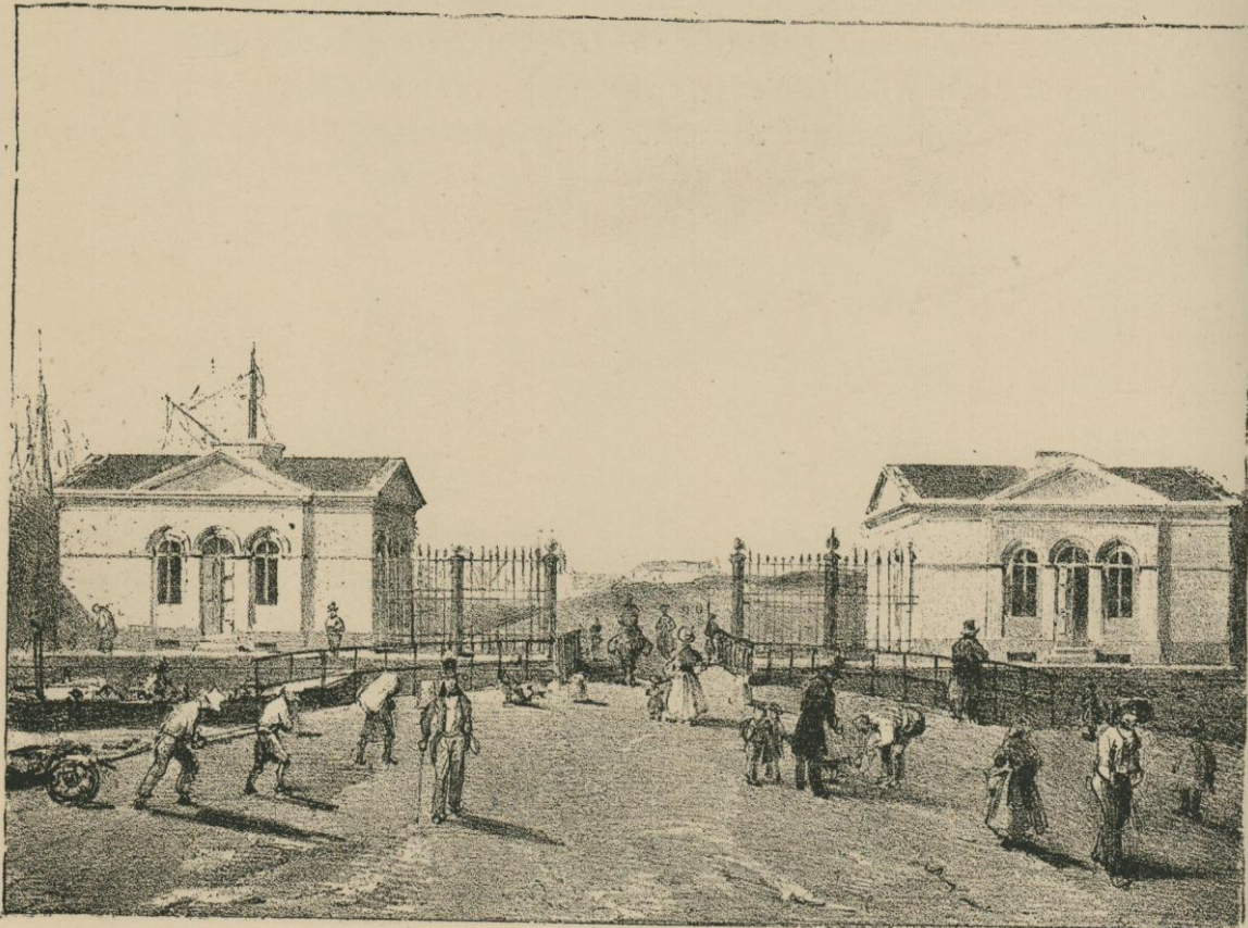
PORTE DU RIVAGE.

C'était encore un plaisir qui semblait réservé aux riches et aux gens du monde, et la société s'y donnait rendez-vous pour y lutter d'élégance et de luxe. Ceux qui ont vu les courses de Bruxelles depuis quelques années, et qui savent l'empressement avec lequel on s'y rend et l'importance qu'elles ont prise dans la vie bruxelloise, liront avec curiosité cet article de sport primitif. Le voici :